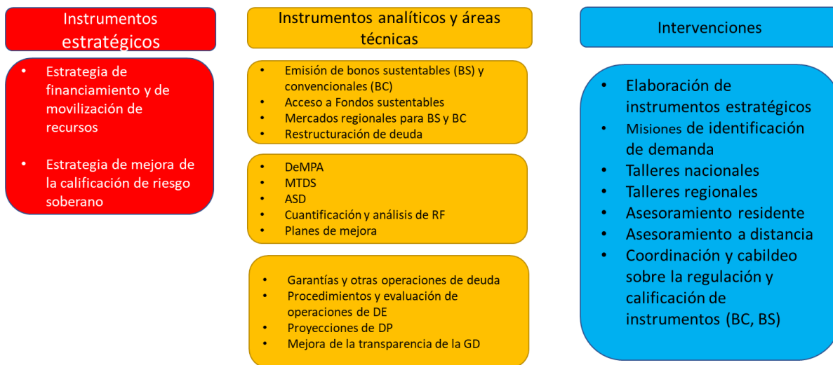
Ilustración 2. Marco general de la posible AT en gestión de deuda y financiación sustentable